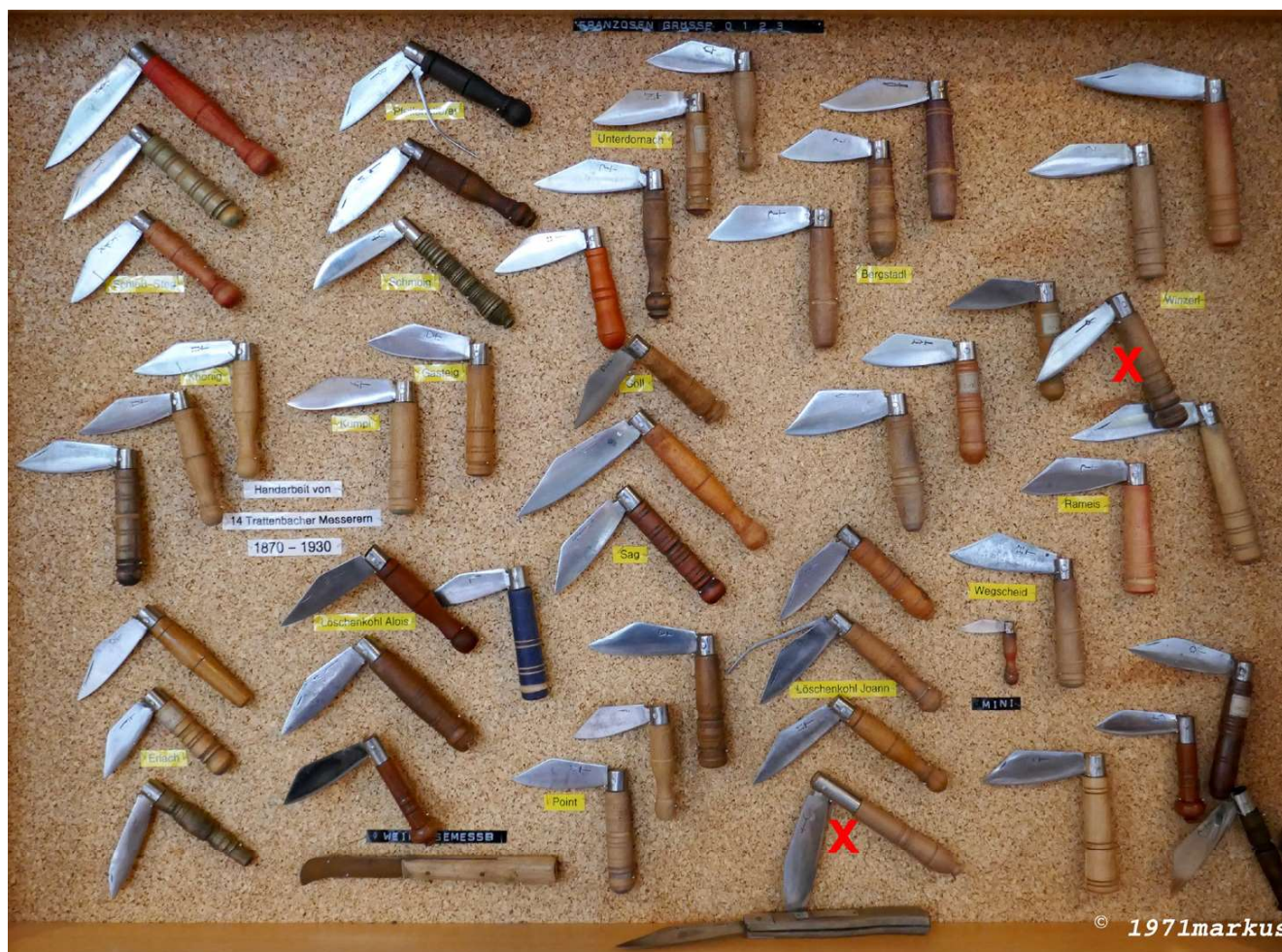
Staré nože z Trattenbachu, identifikované rukojeti jsou označené křížkem.